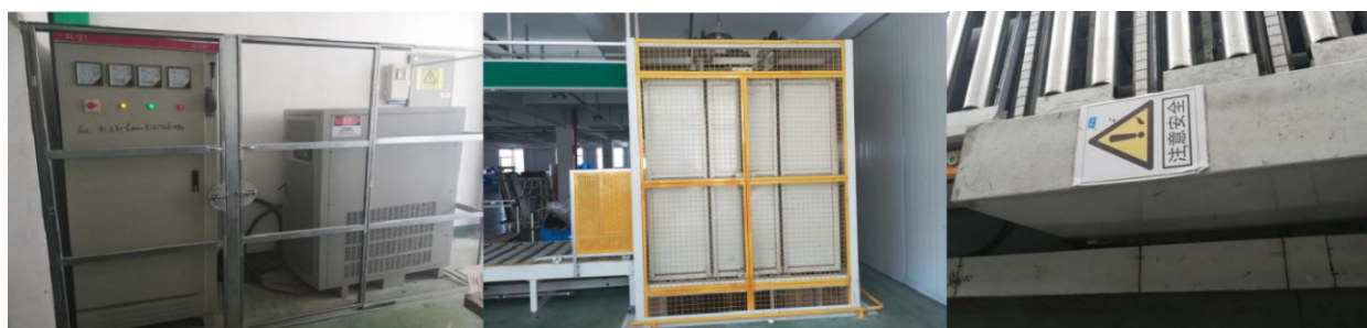
图表 10 车间设备的安全防护网

制订完善员工健康档案，邀请有资质的职业病体检中心对特殊工种、接毒工种进行健康检查，加强对特殊工种、接毒工种的防护；2020年组织56人参加体